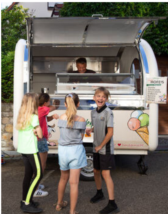
Der Eiswagen kommt in die Grundschule Owen als Ersatz für die Maientagsbrezel.