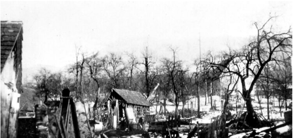
zerstörtes Owen, Kriegsende ehemals Gasthaus Hirsch

Owen. Der „Alt-Owen“-Förderkreis hat einen reich bebilderten Band mit dem Titel „Owen – 17 Tage vor